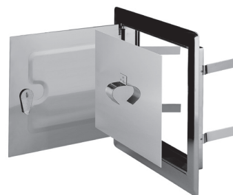
Kolor nierdzewny / Stainless colour Do zastosowania wewnątrz pomieszczeń / For internal use