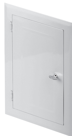
Kolor biały White colour